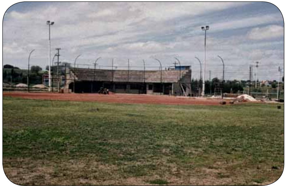
Construcción del Estadio Panamericano "Nafaldo Cargnel". 23 años después de su inauguración, este será el diamante principal del IX Campeonato Mundial Masculino Juvenil 2012.

rios, se comenzó con el piso del Estadio. El escombros grueso lo proveyó la Municipalidad de la Ciudad de Paraná, que estaba levantando el asfalto de la calle Ramírez, con lo cual lo que sacaban de esa obra lo llevaban al Estadio, en donde finalmente se seleccionaba lo que servía para la obra. Luego se consiguieron escombros de ladrillos, los cuales se limpiaban para usarlos en el diamante, mientras que la cal que se quitaba de los mismos se utilizaba para revocar las paredes. Luego se consiguió escombros más fino y se molía con una máquina que se había pedido prestada. Todo se utilizaba. Como dijimos, había crisis económica por todos lados, y era necesario sortearla y llegar a buen puerto para noviembre.